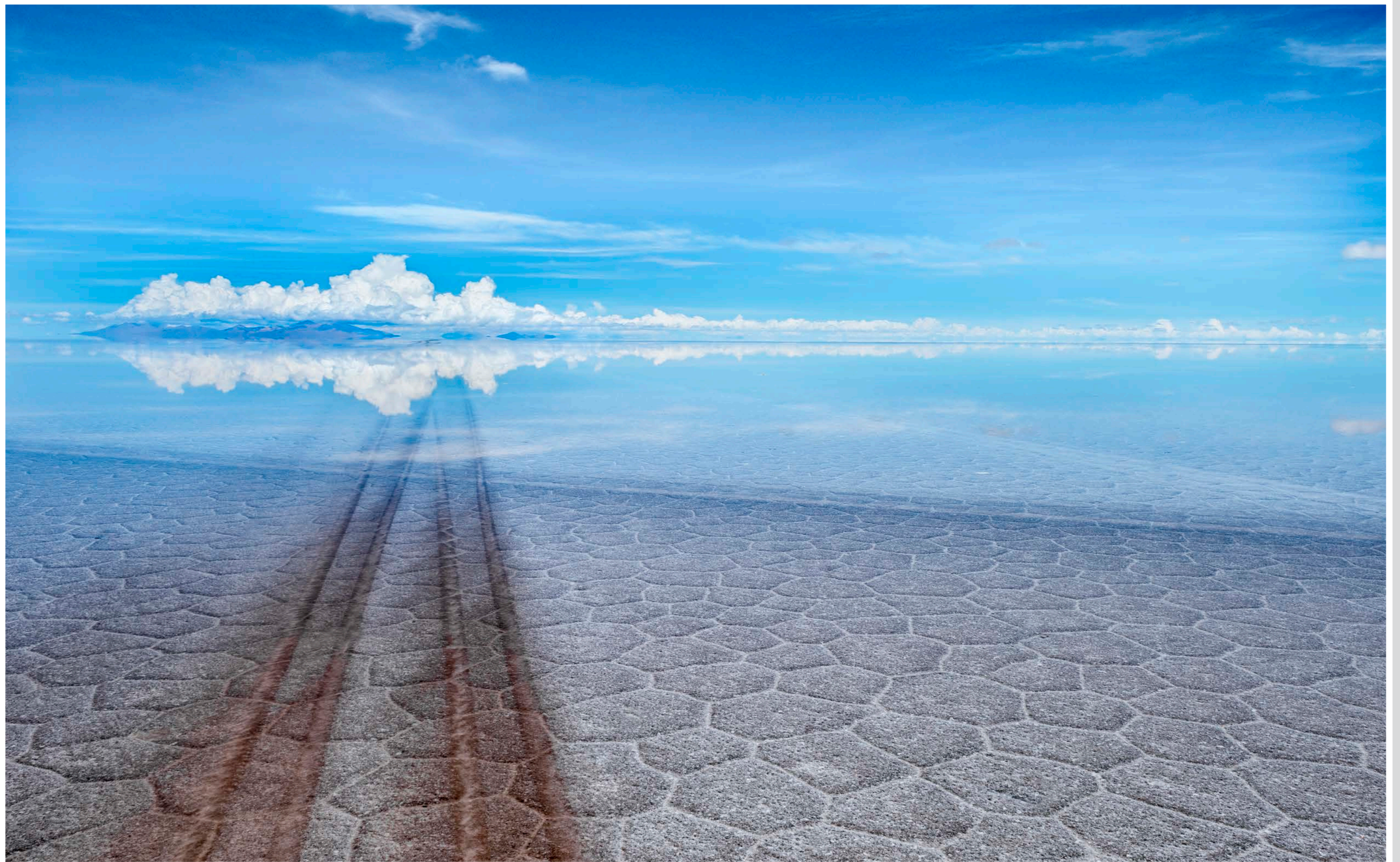
Salar di Uyuni, Bolivia